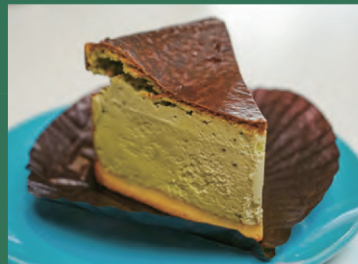
バスク風抹茶のチーズケーキ