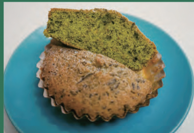
煎茶のマドレーヌ(抹茶入り)

アクセス ● JR関西本線笠置駅から徒歩2分 所在地 ● 笠置町笠置市場16 営業時間 ● 午前9時～午後6時 (金曜・土曜は午後9時まで) 定休日 ● 第1、第3火曜と水曜 連絡先 ● (TEL)090-7964-3068